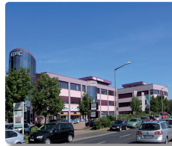
IFS – Institut für Fremdsprachen gGmbH

IFS – Institut für Fremdsprachen gGmbH Carl-Zeiss-Straße 14 97424 Schweinfurt Telefon: (0 97 21) 7 96 83 - 0 Telefax: (0 97 21) 7 96 83 - 29 E-Mail: info@ifs-schweinfurt.de www.ifs-schweinfurt.de